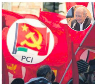
LUTTO SI è spento Eugenio Donise, nella foto tondo, militò nel Partito comunista italiano

► Dalla Fgci al Pci, tra i fondatori dell'Ulivo ► È stato senatore per due legislature «Riferimento per il fronte progressista» «Appassionato di storia e letteratura»